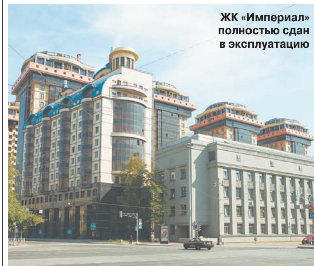
ЖК «Империал» полностью сдан в эксплуатацию

За минувшие двенадцать месяцев застройщик ввел в эксплуатацию более 63 тысяч квадратных метров жилья