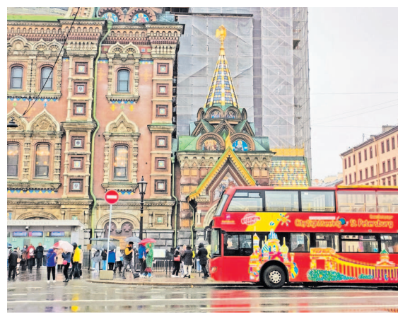
Средства курортного сбора помогают Петербургу делать город комфортнее для туристов.

Налоговые ставки будут зависеть от сезона и вида размещения